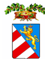
Provincia di Gorizia