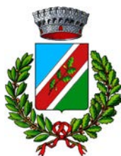
Comune di Doberdò